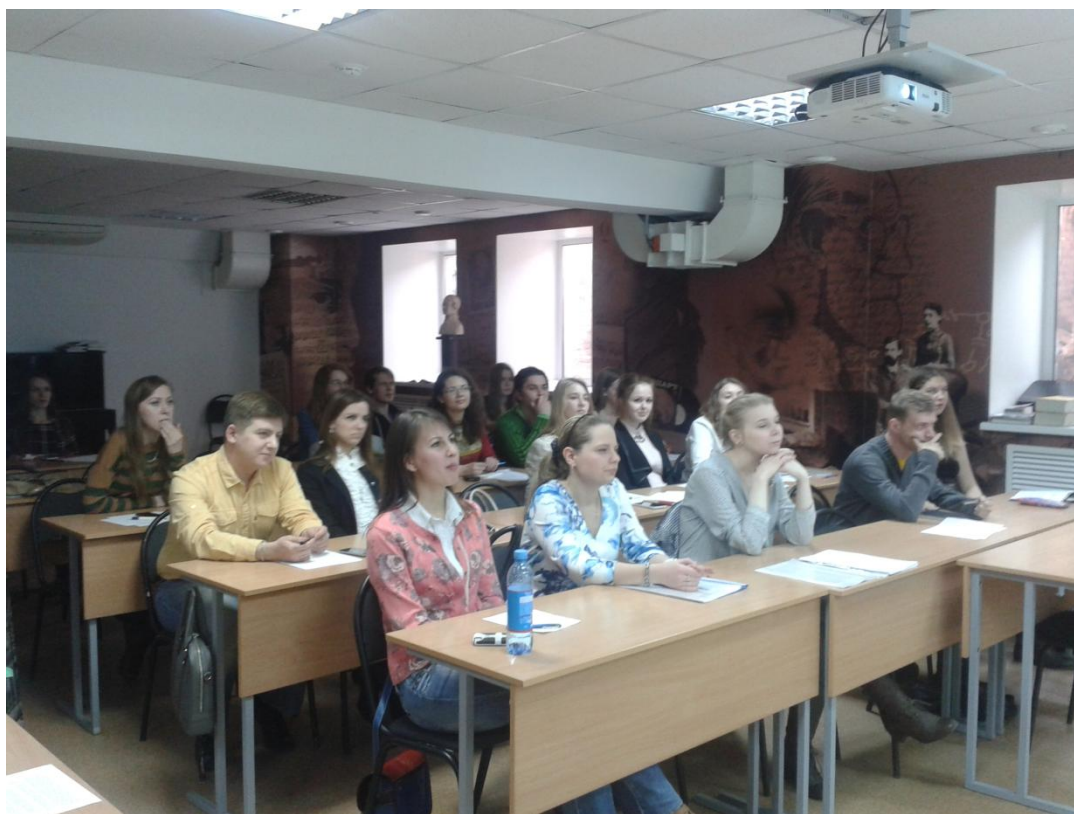
Фото: Участники весенней школы