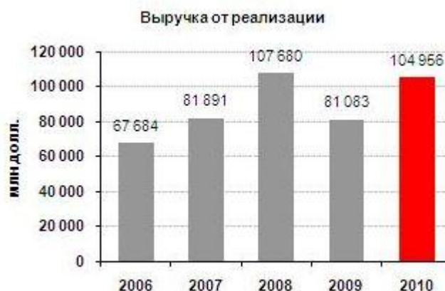
Рис. 2 Выручка ОАО «ЛУКОЙЛ» за 2006-2010 гг., млн. долл.