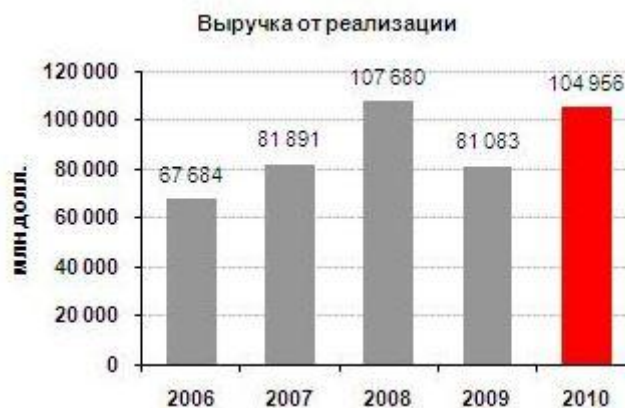
Рис. 2 Выручка ОАО «ЛУКОЙЛ» за 2006-2010 гг., млн. долл.