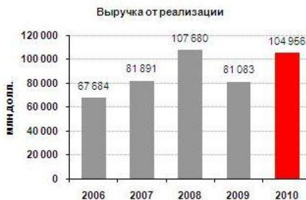
Рис. 2 Выручка ОАО «ЛУКОЙЛ» за 2006-2010 гг., млн. долл.