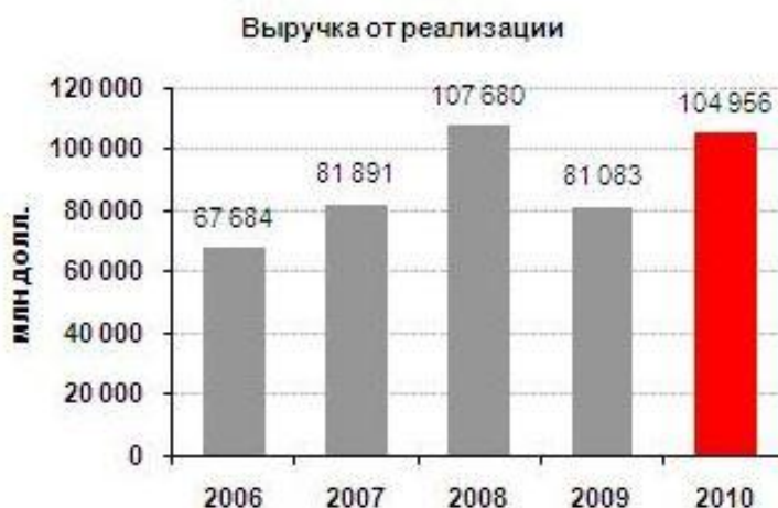
Рис. 2 Выручка ОАО «ЛУКОЙЛ» за 2006-2010 гг., млн. долл.