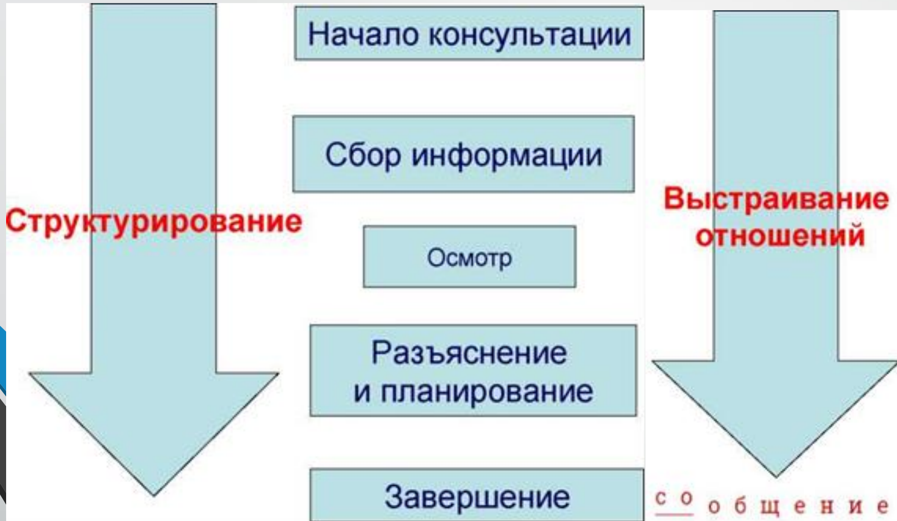
Калгари-Кембриджская модель медицинской консультации