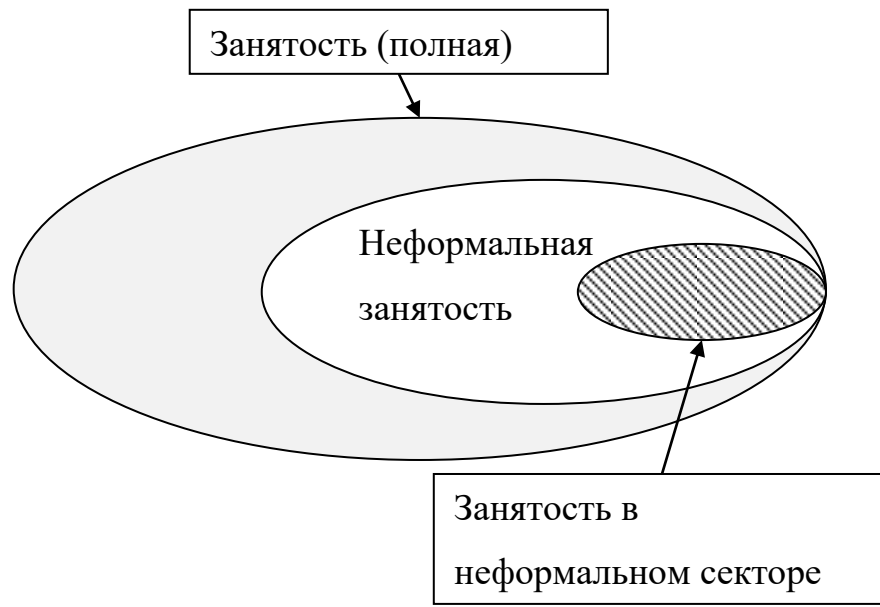
Рис. 1 Сравнение видов занятости