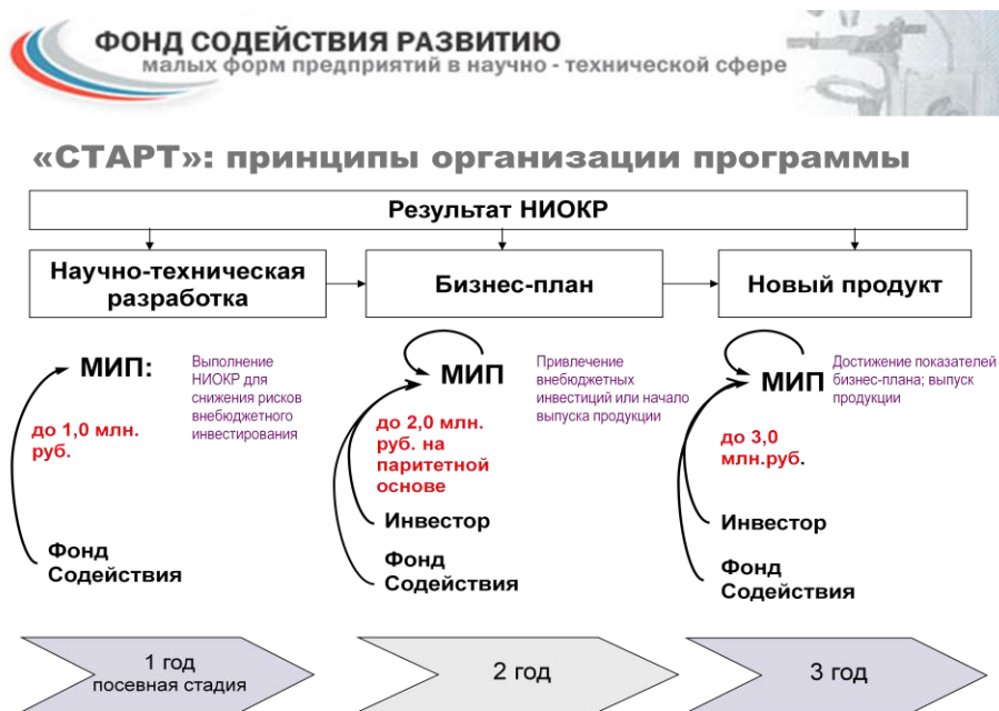
Рисунок 7. - Принцип работы программы СТАРТ

При использовании в работе материалов, заимствованных из литературных источников, цитировании различных авторов, необходимо делать соответствующие ссылки, а в конце работы помещать список использованной литературы. Не только цитаты, но и произвольное изложение заимствованных из литературы принципиальных положений включаются в выпускную квалификационную работу со ссылкой на источник.