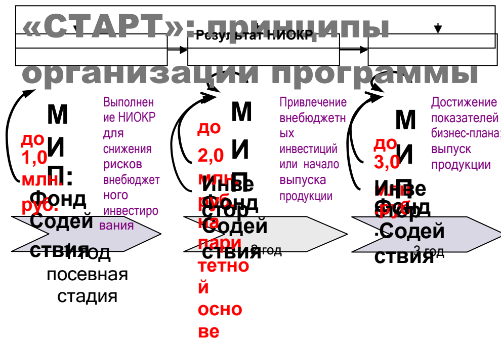
Рисунок 7. - Принцип работы программы СТАРТ

При использовании в работе материалов, заимствованных из литературных источников, цитировании различных авторов, необходимо делать соответствующие ссылки, а в конце работы помещать список использованной литературы. Не только цитаты, но и произвольное изложение заимствованных из литературы принципиальных положений включаются в выпускную квалификационную работу со ссылкой на источник.