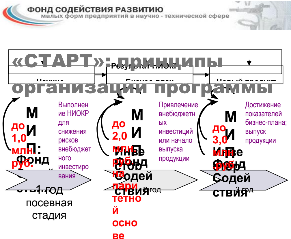
Рисунок 7. - Принцип работы программы СТАРТ

При использовании в работе материалов, заимствованных из литературных источников, цитировании различных авторов, необходимо делать соответствующие ссылки, а в конце работы помещать список использованной литературы. Не только цитаты, но и произвольное изложение заимствованных из литературы принципиальных положений включаются в выпускную квалификационную работу со ссылкой на источник.