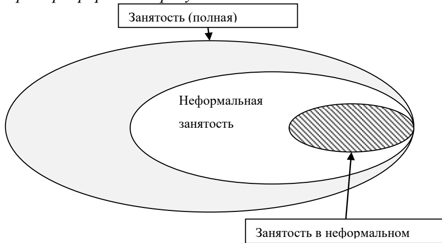
Рис. 1 Сравнение видов занятости