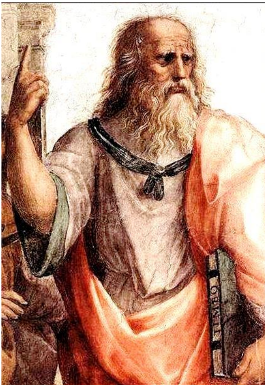
Фрагмент фрески Рафаэля Санти «Афинская школа» - Платон

Алиса встретила двух братьев Труляля и Траляля. В лесу неподалеку кто-то громко пыхтел, словно огромный паровоз. Это был Черный король, который немного расхрапелся. Лежал он под кустом и храпел с такой силой, что все деревья сотрясались. — Так можно себе и голову отхрапеть! — заметил Труляля. — Как бы он не простудился, — забеспокоилась Алиса, которая была очень заботливой девочкой. — Ведь он лежит на сырой траве! — Ему снится сон! — сказал Траляля. — И как по твоему, кто ему снится?! — Не знаю, — ответила Алиса. — Этого никто сказать не может. — Ему снишься ты! — закричал Траляля и радостно захлопал в ладоши. — Если бы он не видел тебя во сне, где бы, интересно, ты была?