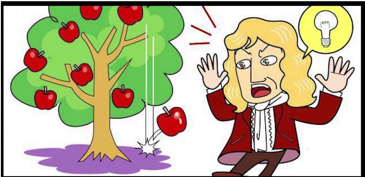
Исаак Ньютон и «яблоко»