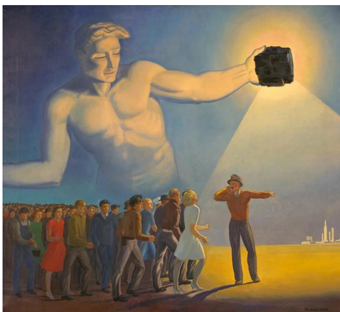
Рокуэлл Кент "Сверхчеловек"

Рассмотрите данные произведения и выполните задания.