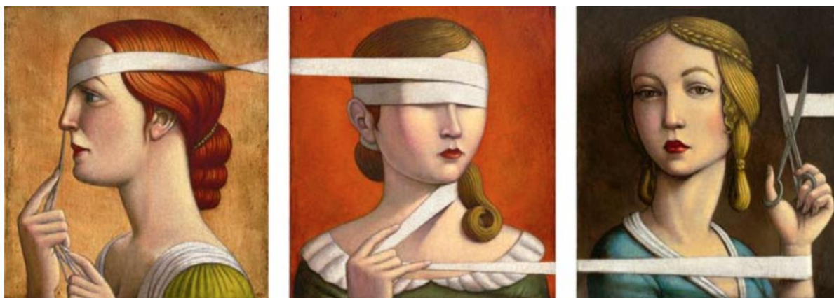
Марк Буркхардт «Три сестры»

Рассмотрите данные произведения и выполните задания.