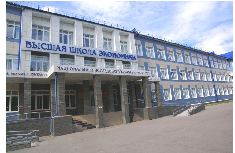
Ул. Львовская, 1В