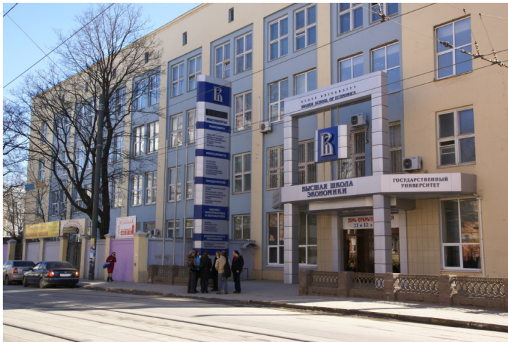
Ул. Б. Печерская, 25/12