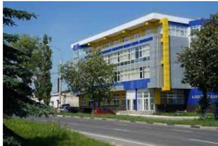
Ул. Родионова, 136